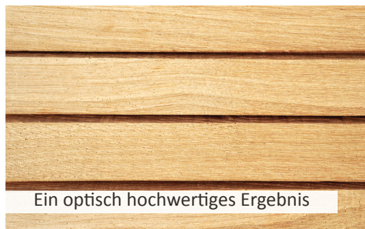
Ein optisch hochwertiges Ergebnis