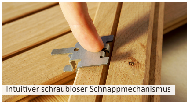
Intuitiver schraubloser Schnappmechanismus

Drei Schritte. Mehr sind nicht erforderlich, um mit dem TIGA innerhalb kurzer Zeit hochwertige, langlebige Fassaden zu errichten: Einfach die Leiste auf dem unsichtbaren Verbinder aufsetzen, mittels Einklicken befestigen und den nächsten TIGA anschrauben.